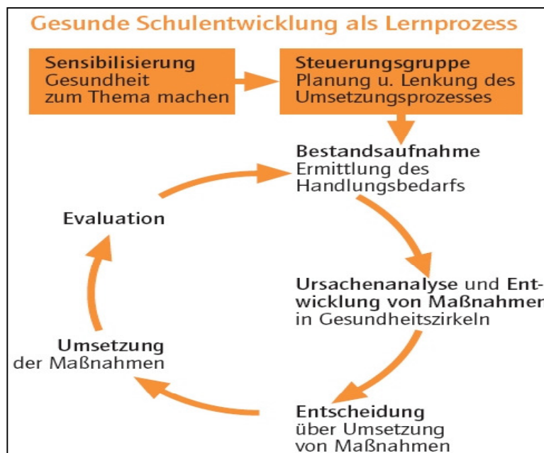
Abb. 2: Gesunde Schule als Lernprozess

Das Projekt folgt dem Settingansatz und den Prinzipien des betrieblichen Gesundheitsmanagements: Ganzheitlichkeit, Partizipation, Integration und Projektmanagement. Um den Einstieg in Veränderungsprozesse der Organisation Schule zu erreichen, orientiert sich der Modellversuch an den Instrumenten der Projektorganisation. Gesundheitsfördernde Schulentwicklung wird als Lernprozess aufgefasst, der aus den folgenden Schritten besteht: